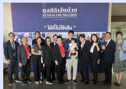
介護用ベッド等機材寄贈式典にて