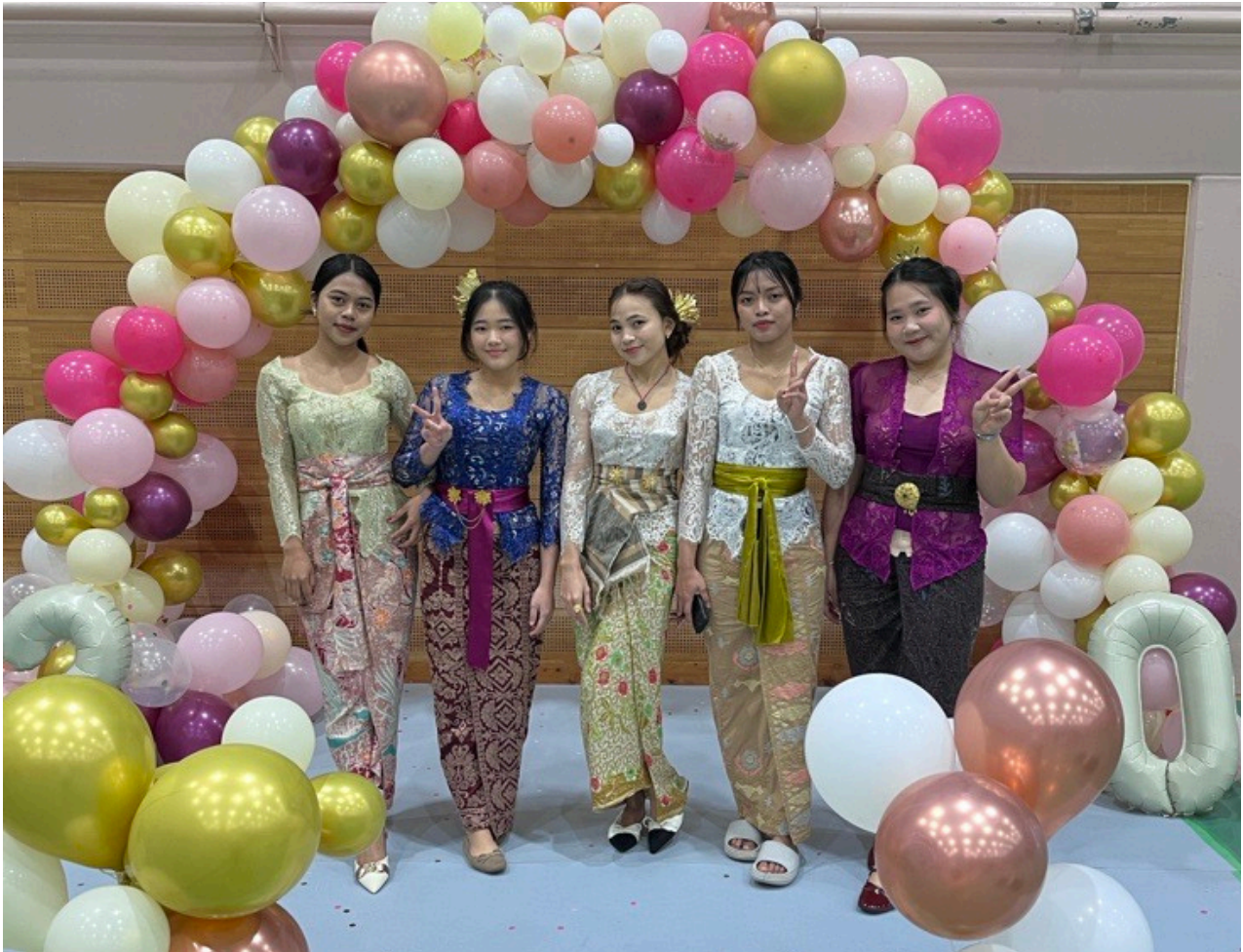
宮崎県「新富町はたちの集い（成人式）」に出席した技能実習生5名（児湯養鶏農業協同組合様）