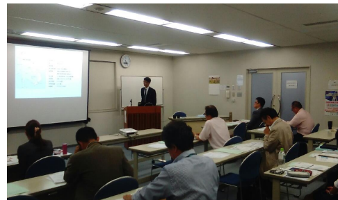
■Tỉnh tr ng h i th o(H i tr ng Fukuoka)