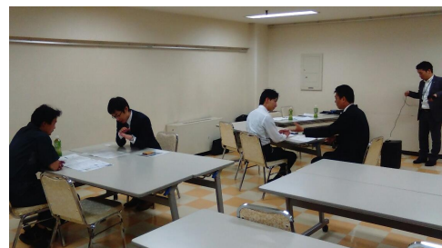
■Tỉnh tr ng ph ng v n riêng(H i tr ng Kanazawa)