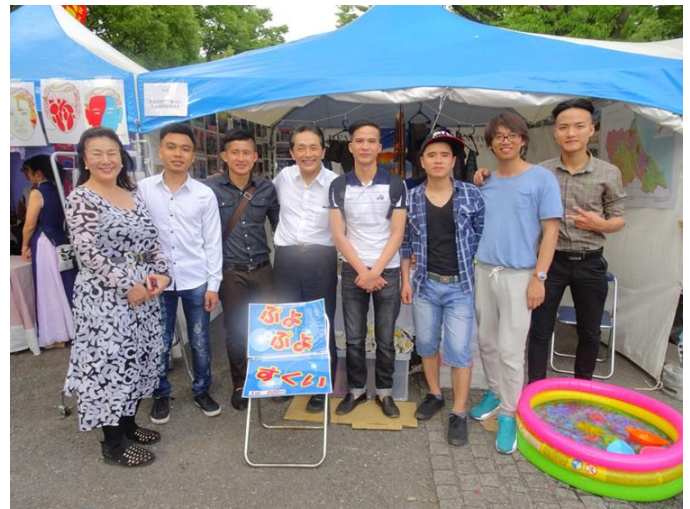
(Hình trái) Trò chơi nước PuyoPuyo