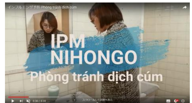
Video giới thiệu về phòng chống dịch cúm