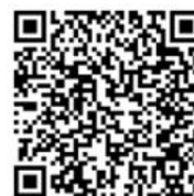
FB IPM tiếng Nhật