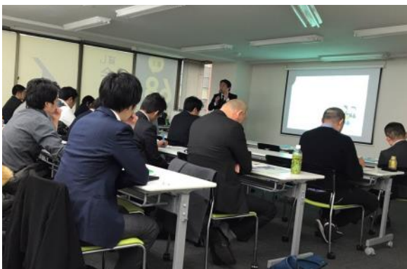
Hình ảnh hội trường ngày hội thảo