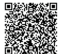
Kênh YouTube IPM tiếng Nhật