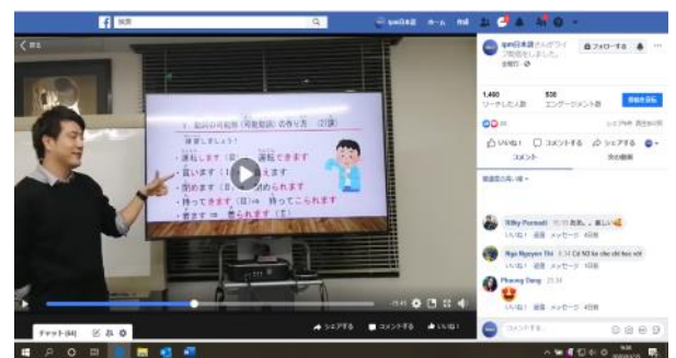
Video các buổi học tiếng Nhật