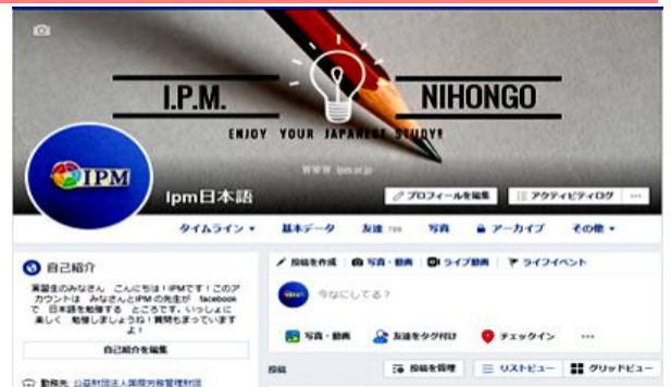
Trang Facebook IPM

Chúng tôi dự định sẽ tiếp tục sản xuất những video bổ ích nên hy vọng sẽ giúp ích cho không chỉ thực tập sinh mà các xí nghiệp và công ty.