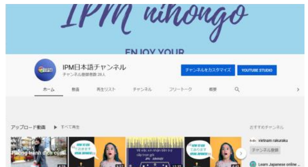
Kênh YouTube IPM tiếng Nhật