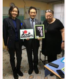
giám đốc Batofu cũng thăm cơ sở điều dưỡng

Giám đốc cũng chia sẻ về tương lai: “Tôi muốn phái cử những người đã có những kiến thức cơ bản về tiếng Nhật, và đã quen với việc tiếp xúc với người khác đến Nhật”, bản thân giám đốc cũng đã từng có kinh nghiệm làm việc điều dưỡng tại Nhật, nên có thể tạo ra những kế hoạch phù hợp hơn. Ông cũng chú ý đến việc phân phối nhân lực bằng cách nỗ lực bằng hợp đồng với các cơ sở điều dưỡng tư nhân bằng hợp đồng về cơ chế thực tập điều dưỡng, ví dụ như không để nhân viên khác và nhân viên văn phòng để có thể trả lương cao cho 4 người giao viên Nhật.