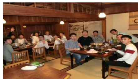
Buổi ăn cơm thân mật nâng cao tinh thần đoàn kết trong công ty