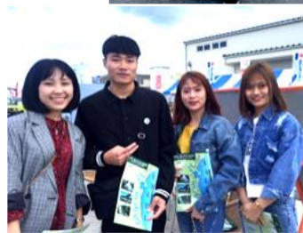
Các TTS hào hứng với “tham quan con kênh nối giữa vịnh sendai và vịnh matsushima bằng thuyền nhỏ”