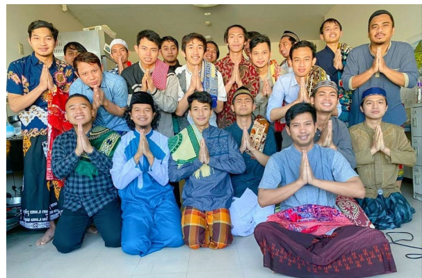
「実習生の断食明けの挨拶 ゴウダ静岡工場様」

「実習の妨げにならない範囲で」とは言われているものの、ラマダン期間中は「脱水症状」や「熱中症」を引き起こしてしまうこともありますので、実習中の様子はしっかり見ておくことが大切です。